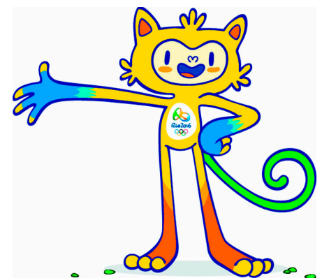
Mishka, Snow Leopard, Zaika