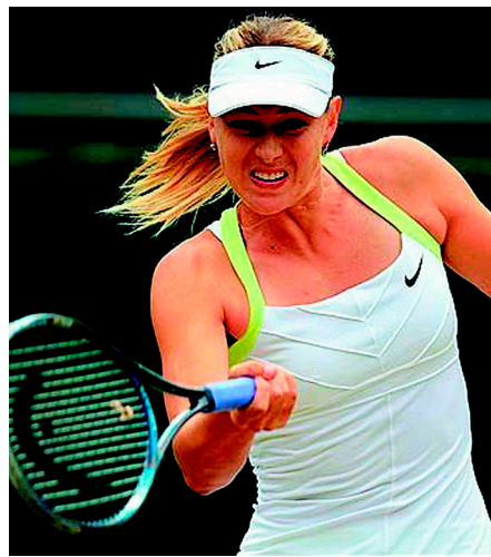
final of 2015 Australian Open? - Maria Sharapova