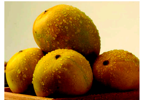
2014? - Alphonso