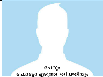
പേരും ഫോട്ടോ എടുത്ത തീയതിയും