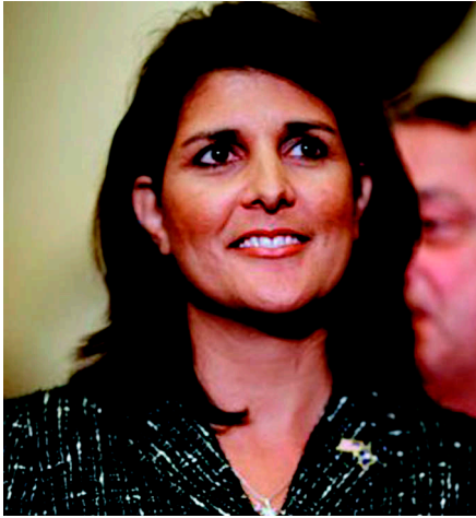
elected to US Parliament from North Carolina- Nikki Haley