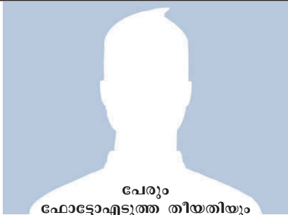
പേരും ഫോട്ടോ എടുത്ത തീയതിയും