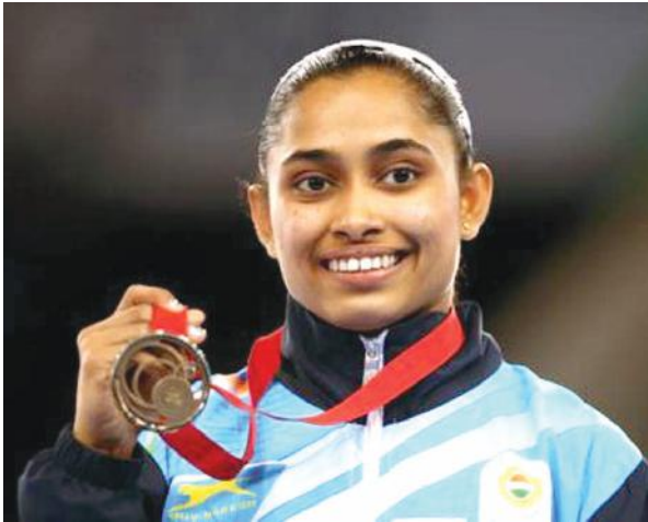
of FIG Artistic Gymnastics World Challenge Cup 2018 in Turkey is Deepa Karmakar.