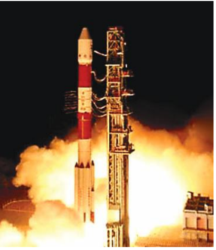
ക്ഷണത്തിനുള്ള ഇമേജിങ് ഉപഗ്രഹം - റിസാറ്റ് 2 ബി 18. ഈയിടെ അന്തരിച്ച മുൻ തായ്‌ലൻഡ് പ്രധാനമന്ത്രി - പ്രേം തിൻസുലനൊന്