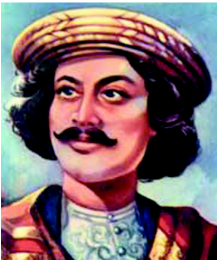
രാജാറാം മോഹൻ റോയ് (1772-1833)