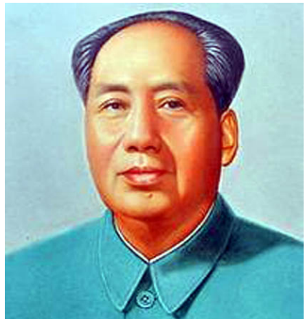
മാവോ സേ തുങ്