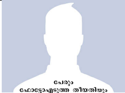
പേരും ഫോട്ടോ എടുത്ത തീയതിയും