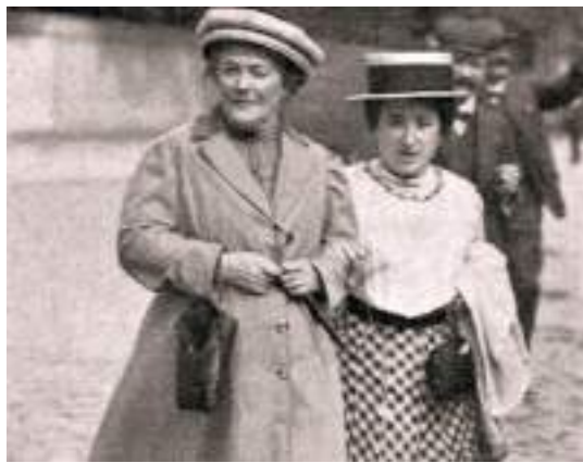
ക്ലോറ സെൽകിനും റോസ ലെക്സംബർഗും

തുടർന്ന് എല്ലാ മാർച്ച് 8 നും സ്ത്രീകൾ ആവേശഭരിതരായി അവകാശ സമരങ്ങൾ നടത്തി. 1911 ൽ യൂറോപ്പിൽ ഒരു ലക്ഷത്തിലേറെ സ്ത്രീകളാണ് വനിതാദിനത്തിൽ പ്രകടനം നടത്തിയത്. ലോക മഹായുദ്ധം കൊടുമ്പിരികൊണ്ടിരിക്കുന്ന ആ കാലത്ത് സമാധാനത്തിനും ന്യായമായ കൂലിക്കുവേണ്ടിയും സാമ്രാജ്യത്വത്തിനെതിരെയും സ്ത്രീകൾ വനിതാദിനത്തിൽ പ്രക്ഷോഭംഗത്തെത്തി.