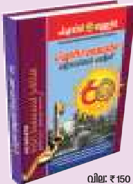
വില: ₹ 150