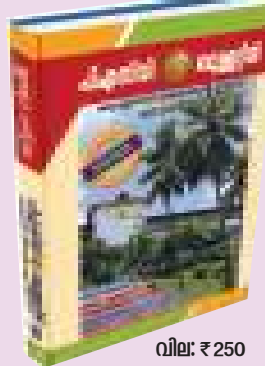
വില: ₹ 250