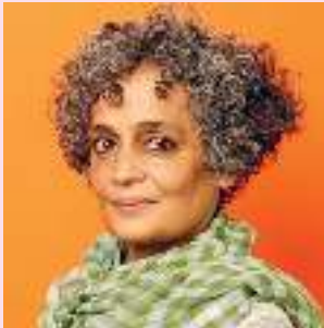
(അരുന്ധതി റോയ്: അഭിമുഖം മാതൃഭൂമി ഓണപ്പതിപ്പ്- 2021)

“എനിക്ക് തോന്നുന്നില്ല, അമേരിക്കയ്ക്ക് സ്വന്തമായല്ലാതെ, മറ്റൊരാൾക്കു വേണ്ടി ഒരു വികാരം ഉണ്ടാകുമെന്ന്. അതിലും അതിശയകരമായ കാര്യം, അടിമത്തത്തിന്റെയും വംശഹത്യയുടെയും ചരിത്രമുള്ള വർത്തമാനകാലത്ത്, നിരന്തരമായ യുദ്ധങ്ങളൊക്കെ നടത്തുന്ന അവർ ഇപ്പോഴും സ്വയം വിശ്വസിക്കുന്നത് ജനാധിപത്യത്തിന്റെയും, മനുഷ്യാവകാശങ്ങളുടെയും മുർത്തരൂപമായാണ്”.