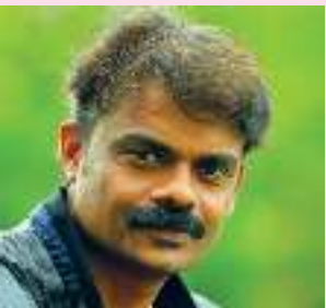
(ഫ്രാൻസിസ് നൊറോണ: ഒഴക്ക് (ക്രമ) മാതൃഭൂമി ഓണപ്പതിപ്പ് 2021)

“തോറ്റും ജയിച്ചും പത്തിൽ എത്തിയപ്പോഴേക്കും ഒപ്പമുളളവൻ മാത്രം മുണ്ടുടുത്തു. പൊക്കംവെച്ചെങ്കിലും പാകത്തിനുള്ളത് കിട്ടാതെ ഞാനെല്ലാം നികരേൽ ഒതുക്കി. കരച്ചിലോടെയാണെങ്കിലും മരിച്ചുപോയ അച്ഛന്റെ തുരുമ്പുകറ പാഞ്ഞ ഒറ്റമുണ്ട് അമ്മ രണ്ടായി പകുത്തു. മുറിക്കഷണം ചുറ്റി സ്കൂളിലെത്തിയതും പാതിമുണ്ടെന്നെ വിളിപ്പേരുകൂടി വീണു