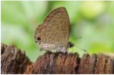
ത്തിന് Nacaduba Sinhala Ramaswami Sadasivan എന്ന് നാമകരണം ചെയ്തു.