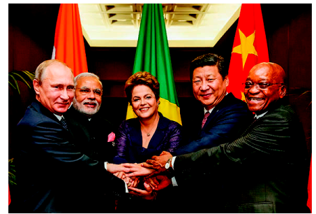
Brazil, Russia, India, China and South Africa