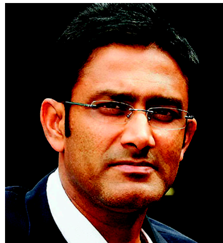
into ICC Hall of Fame in February 2015? Anil Kumble