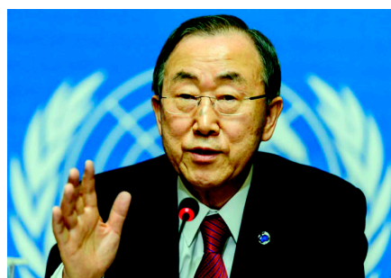
Ban Ki Moon