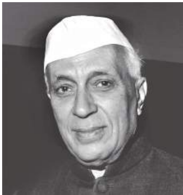
(സി) ജവാഹർലാൽ നെഹ്രു (ഡി) സർദാർ പട്ടേൽ